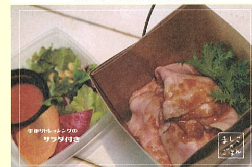
ローストポーク丼 788円