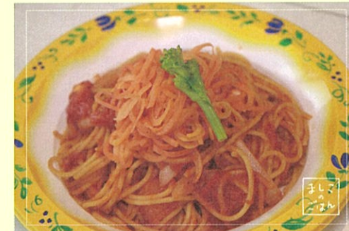
海老とトマトのパスタ 658円

一部フードメニューをテイクアウト提供 券売機によるソフトクリーム・ドリンク類も 通常通り販売いたしております