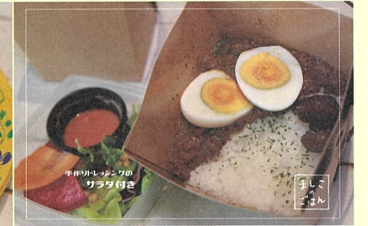
根菜キーマカレー 688円