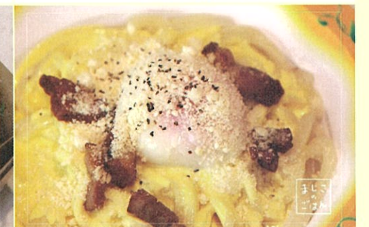
カルボナーラどん 658円